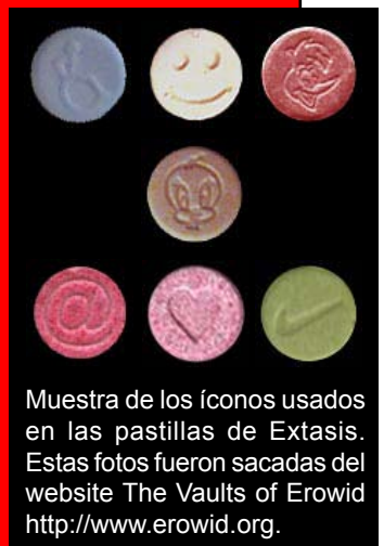
Muestra de los íconos usados en las pastillas de Extasis. Estas fotos fueron sacadas del website The Vaults of Erowid http://www.erowid.org .